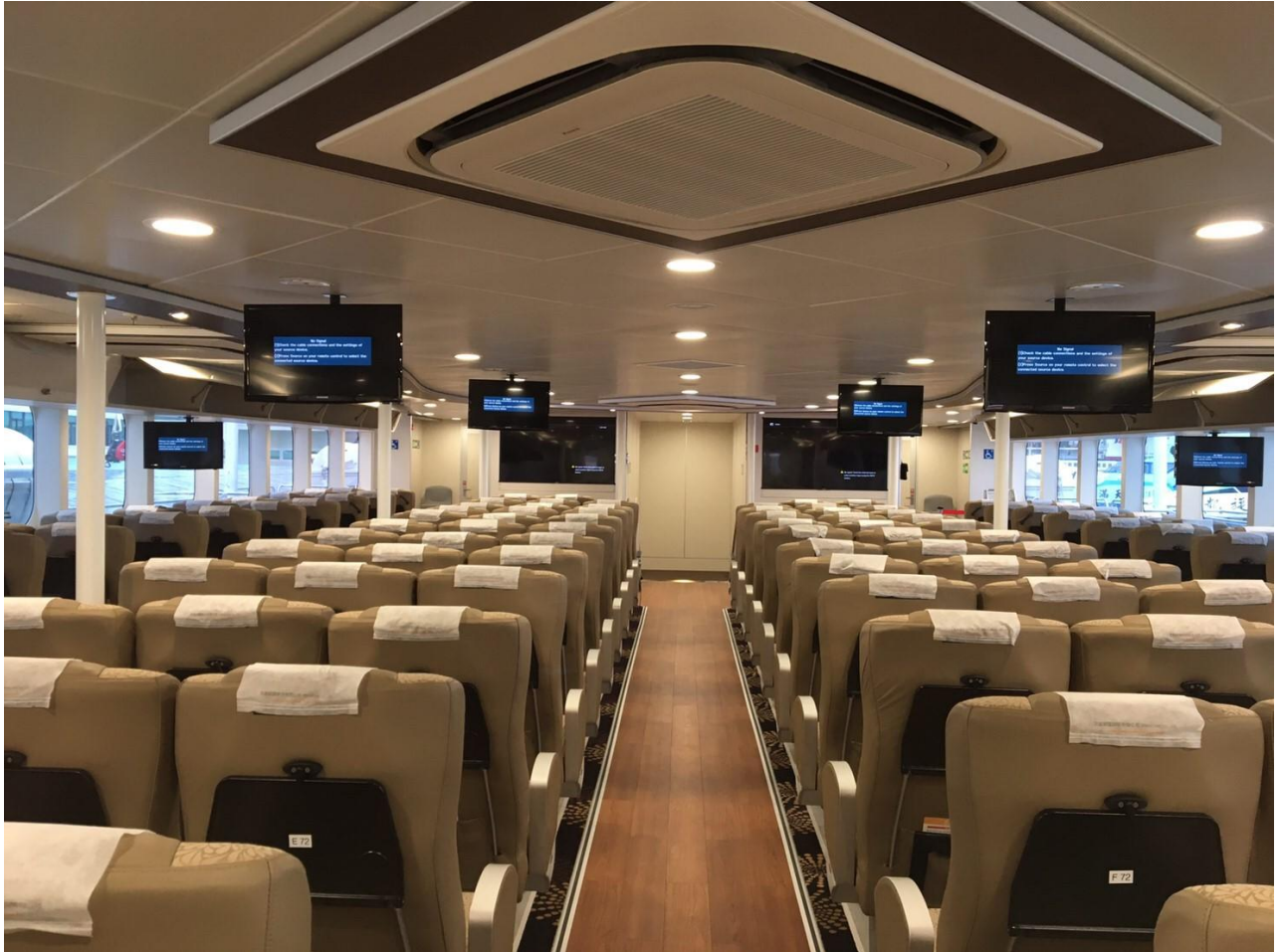
雲豹/藍鵲輪客艙【商務艙】